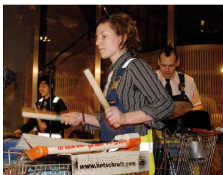
Hot Schrott Band

Die Hot Schrott Band war das erste Projekt der BürgerStiftung Hamburg. Auf alten Autotüren, Blechkanistern und Plastikfässern trommelt die Band mit abgesägten Besenstielen den Rhythmus.